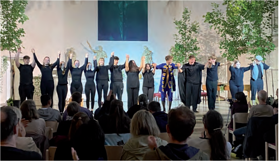
„Darstellendes-Spiel-Kurs“ des 12. Jahrgangs der IGS Wunstorf.